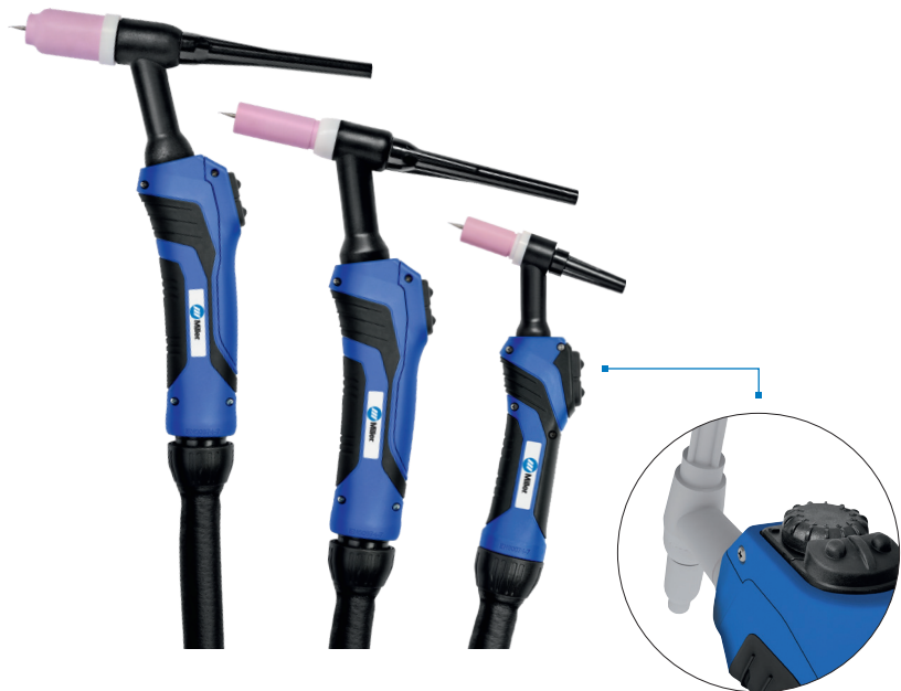
*Fernregelung mit Poti

Die WIG Brenner werden mit einer 2.4 mm Miller®|Weldcraft® (WL 20, 2% Lanthan) Ausrüstung ausgestattet. Die blaue Elektrode sorgt für einen stabilen Lichtbogen in AC- und DC-Prozessen, größere Langlebigkeit als andere Elektrodentypen, die Fähigkeit, eine Elektrode mit kleinerem Durchmesser für die gleiche Anwendung zu verwenden, höhere Strombelastbarkeit und weniger Wolframverschleiß.